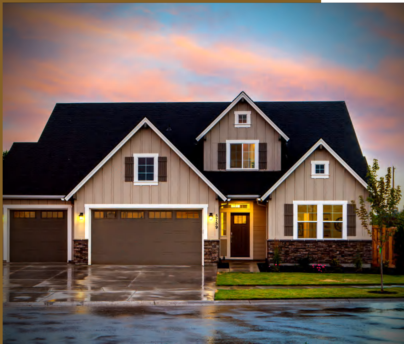
TABELA DE SERVIÇOS